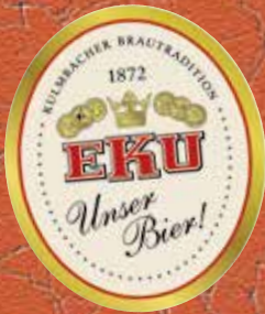
KULMBACHER BIERE GRIECHISCHE WEINE